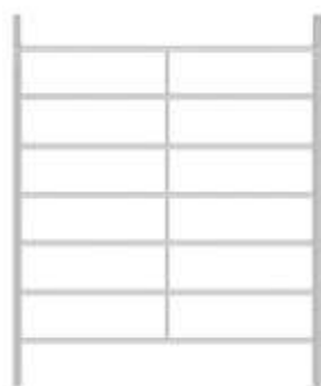
Vertikální rám 1,96 m