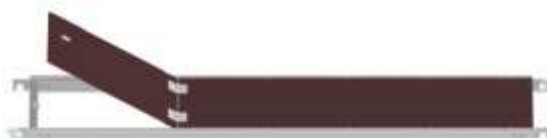
Podlážka s otvorem 2,6 m